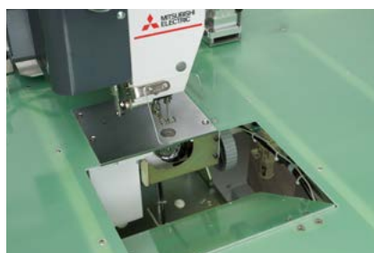
上からでもボビン交換可能! ボビン開閉窓