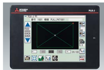
見やすく操作も簡単! 6.5インチカラー操作パネル