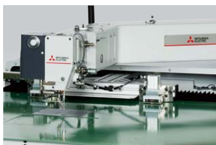
楽々メンテナンス! 新アーム形状、ガラスエポキシ製すべり板